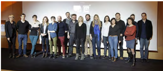
Les auteurs de la Sélection 2017

La Fondation accompagne les talents dans la durée.