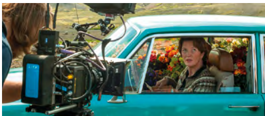
Tournage de A WOMAN AT WAR de Benedikt Erlingsson, lauréat 2016

L'Aide à la Création consiste à récompenser chaque année 4 projets de longs métrages de fiction (premiers et seconds films), sélectionnés sous la forme de scénario et, à attribuer un Prix spécial.