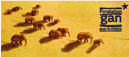
Visuel créé par Michael Dudok de Wit pour les 30 ans de la Fondation

La Fondation est créée par Gan en 1987, lors de la 40 ème édition du Festival de Cannes. Costa-Gavras, alors Président de la Cinéma-thèque, inspire le domaine d'intervention de ce qui allait devenir la première fondation d'entreprise en France en faveur du cinéma, et dont il est toujours le Président d'honneur.