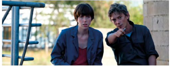
PETIT PAYSAN de Hubert Charuel, lauréat 2015

À ce jour, la Fondation a participé à l'émergence de plus de 180 réalisateurs qui font le cinéma d'aujourd'hui et préparent celui de demain : une belle communauté riche de près de 500 œuvres ! Depuis sa création la Fondation compte :