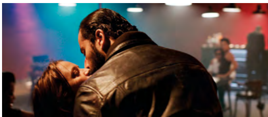
M de Sara Forestier, lauréate 2013

La Fondation Gan pour le Cinéma est une des deux fondations du Groupe Groupama, un des principaux assureurs français, dont l'engagement sociétal passe depuis de nombreuses années par le soutien à la création artistique. La Fondation est fortement liée à l'identité de la marque Gan (lune des trois marques du Groupe).