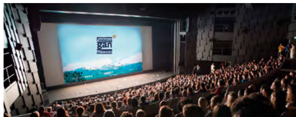
Festival d'Annecy 2017

Historiquement assureur des créateurs d'entreprises, des PME et des professionnels, Gan Assurances est aujourd'hui assureur de tous les "entrepreneurs" dans leur vie privée comme professionnelle. Gan Assurances accompagne ainsi tous ceux qui, de projet en projet, envisagent la vie comme une entreprise.